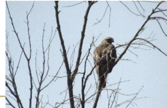
Aguililla cola roja Buteo jamaicensis