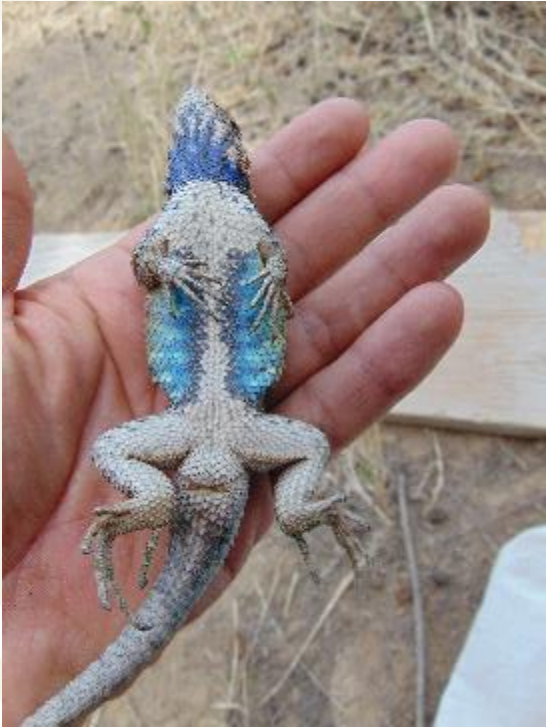
Lagartija espinosa mexicana Sceloporus spinosus