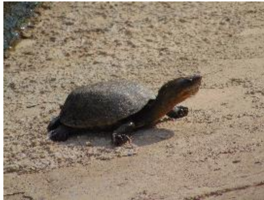
Tortuga pecho quebrado mexicana Kinosternon integrum