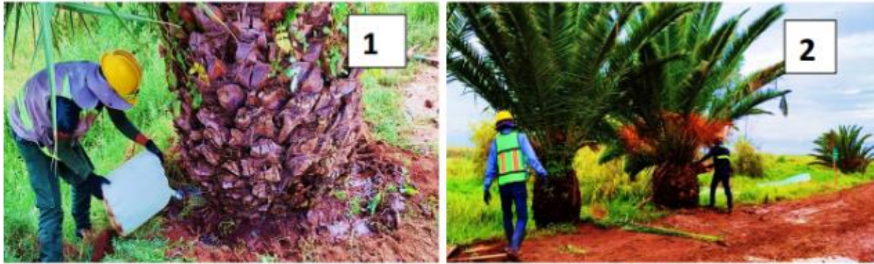
Figura 5. Preparación de palmeras para el proceso de trasplante: aplicación de micorrizas (1) y poda de palmas (2)