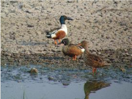
Pato cucharón Spatula clypeata