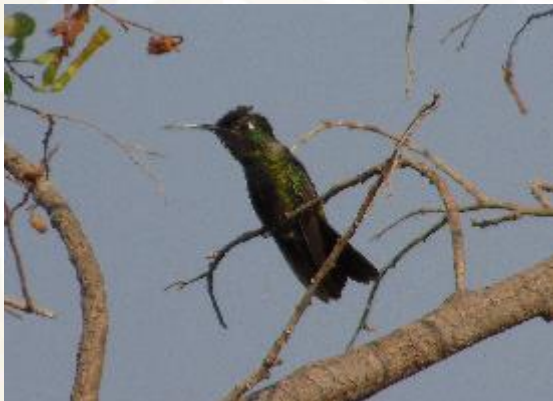
Colibrí pico ancho Cynanthus latirostris