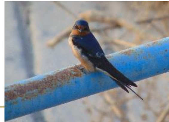
Golondrina tijereta Hirundo rustica