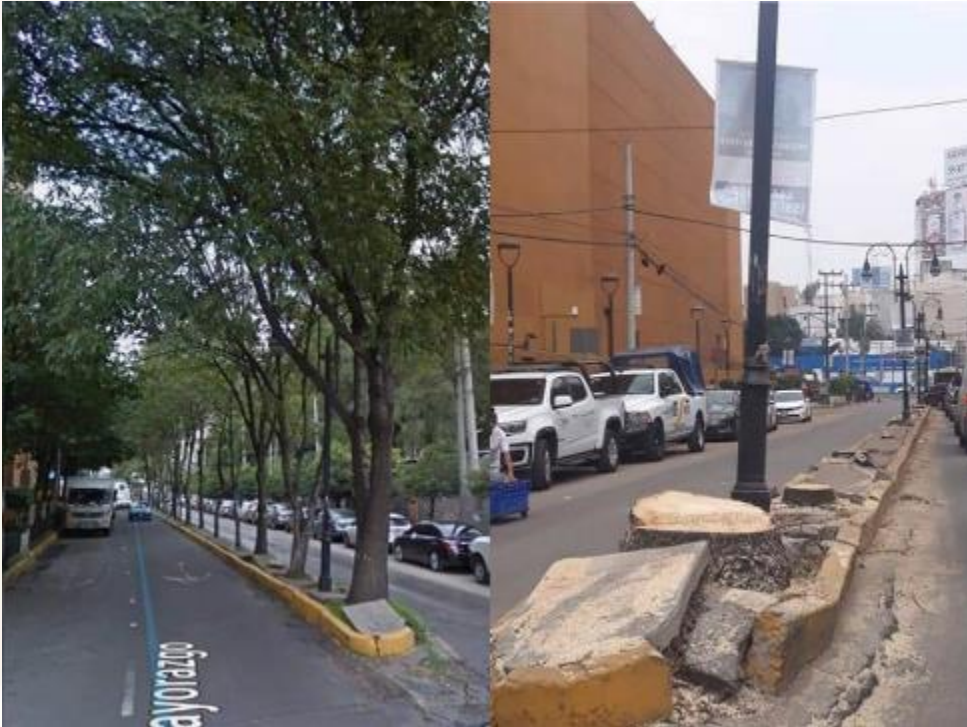
Derribos ejecutados sin autorización.