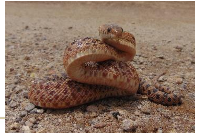
Cincuate Pituophis deppei