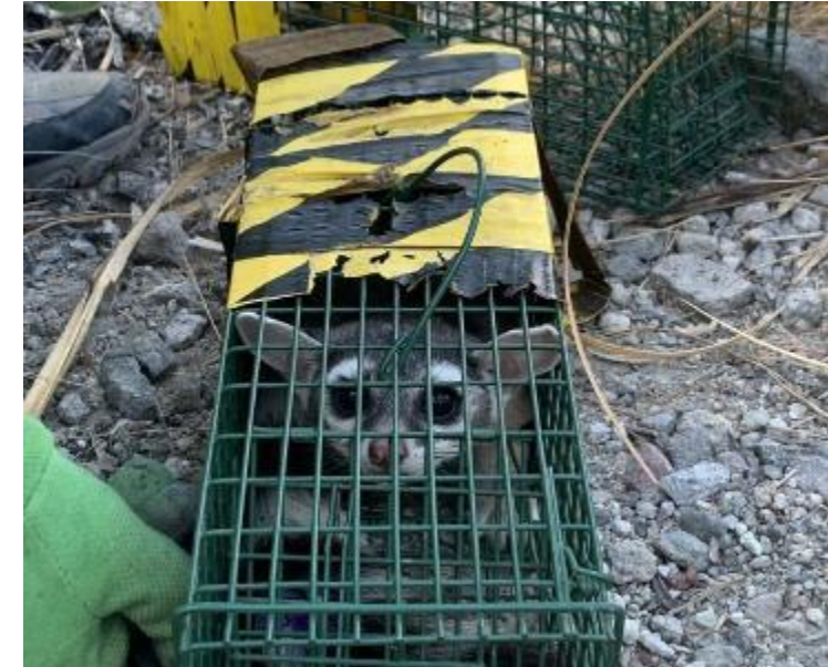
Cacomixtle Bassariscus astutus