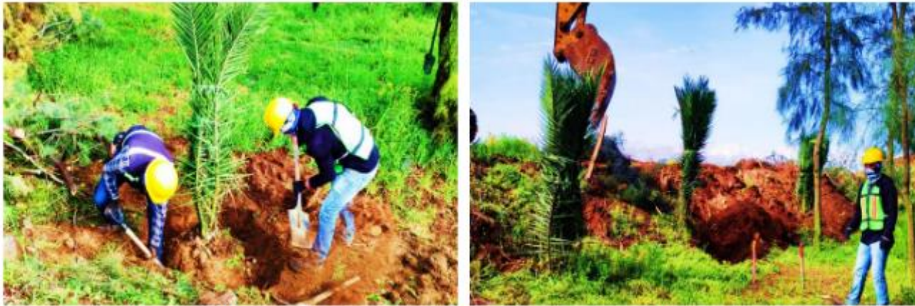
Figura 6. Banqueo de palmeras y protección de palmas durante el proceso