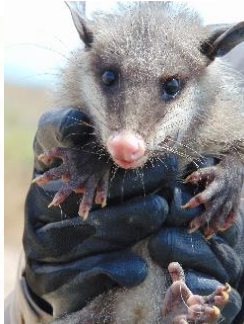
Tlacuache norteño Didelphis virginiana