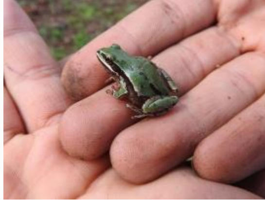
Rana Arborícola de Montaña Hyla eximia