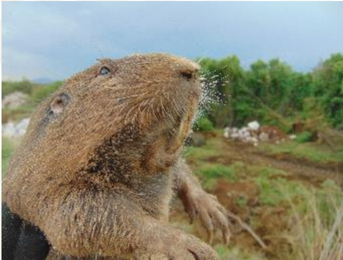
Tuza de la cuenca de México Cratogeomys merriami