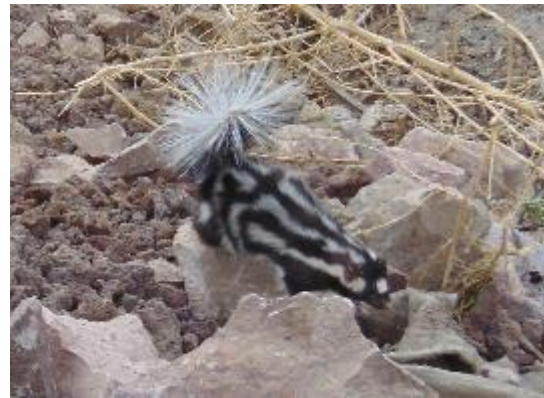
Zorrillo manchado sureño Spilogale angustifrons