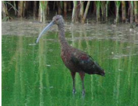
Ibis ojos rojos Plegadis chihi