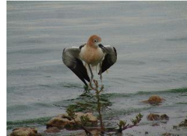
Avoceta americana Recurvirostra americana