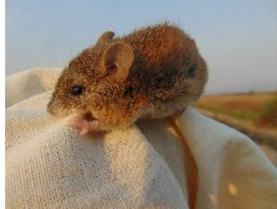
Ratón cosechero común Reithrodontomys megalotis