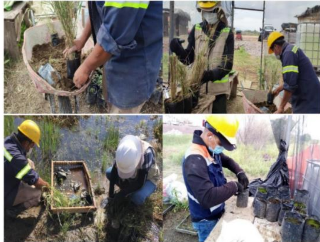
Figura 8. Propagación y reproducción de plantas rescatadas en vivero