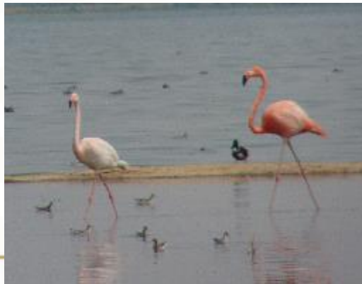
Flamenco americano Phoenicopiterus ruber