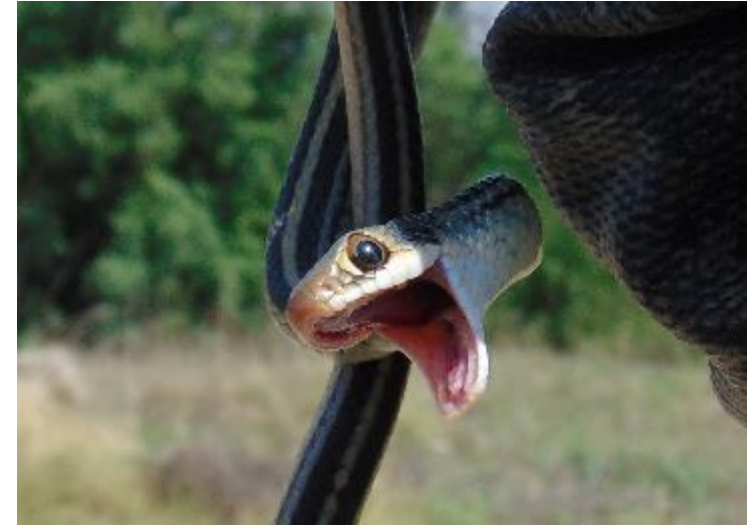
Culebra chata mexicana Salvadora bairdi