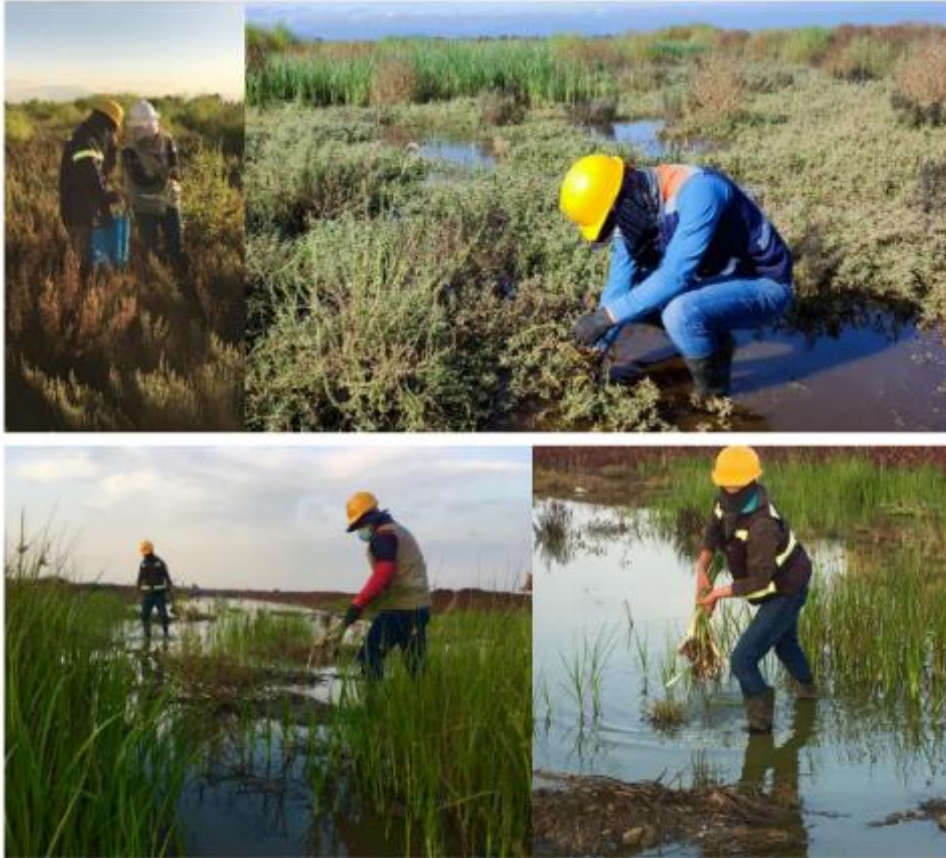
Figura 7. Rescate de flora del estrato herbáceo (plantas hidrofíticas), zona de humedal