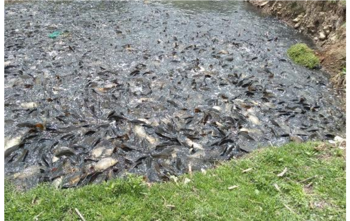
Muerte de fauna acuática.