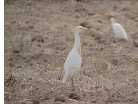
Garza ganadera Bubulcus ibis